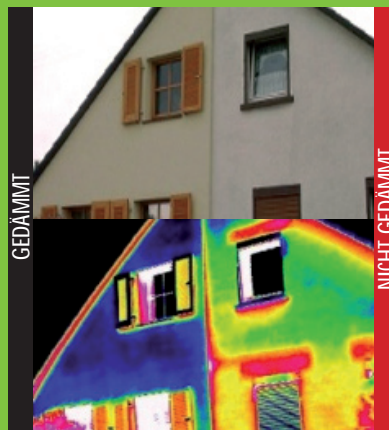
Beispielhafter Energieausweis für Wohngebäude